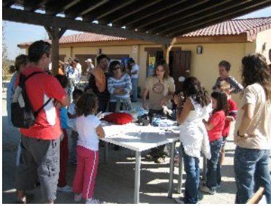
Taller de egagrópilas

Este año nos dividimos y lo realizamos el sábado en Bosque Sur, con talle-