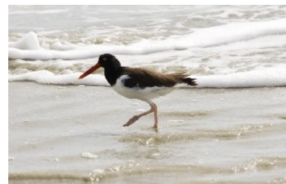
Ostrero americano (Haemantopus palliatus)

Al final vi. 123 especies, y alguna más que no he identificado. En 8 días.