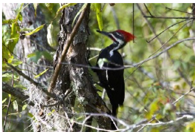
Picamaderos norteamericano (Dyocopus pileatus)

Aprovechando el viaje a una convención, me puse a visitar el estado de Georgia una semana extra como Birdwatcher. Las fechas no eran las idóneas, (finales de septiembre), pero sí encontré algunas aves de paso en sus bosques, y al final del viaje, ya se veían algunas anátidas más, ya que en la época de verano casi no hay variedad.